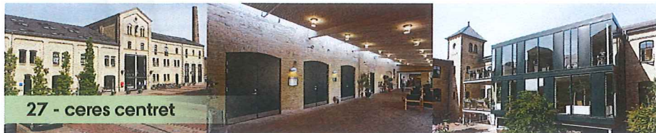
27 - ceres centret